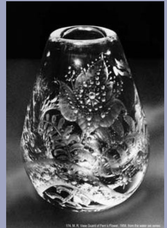
Lindomar Placencia. De la serie Water set . Fotografía/backlight. 130 X 90 cm. 2004