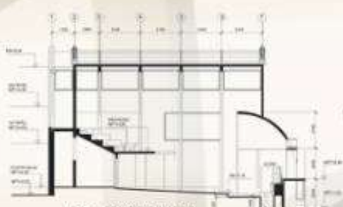
CORTE LONGITUDINAL 1:1