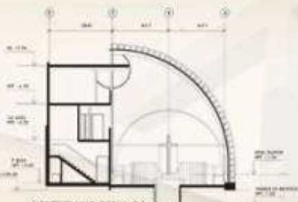
CORTE TRANSVERSAL 2:2