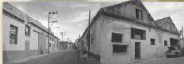
Calle Arbol Seco