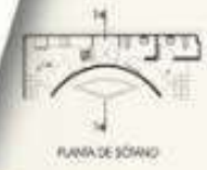
PLANO DE SITIO

País: Cuba Autor: Los Sábados Ubicación: Arbol Seco Ed. Demogue Centro Habana, C. Habana