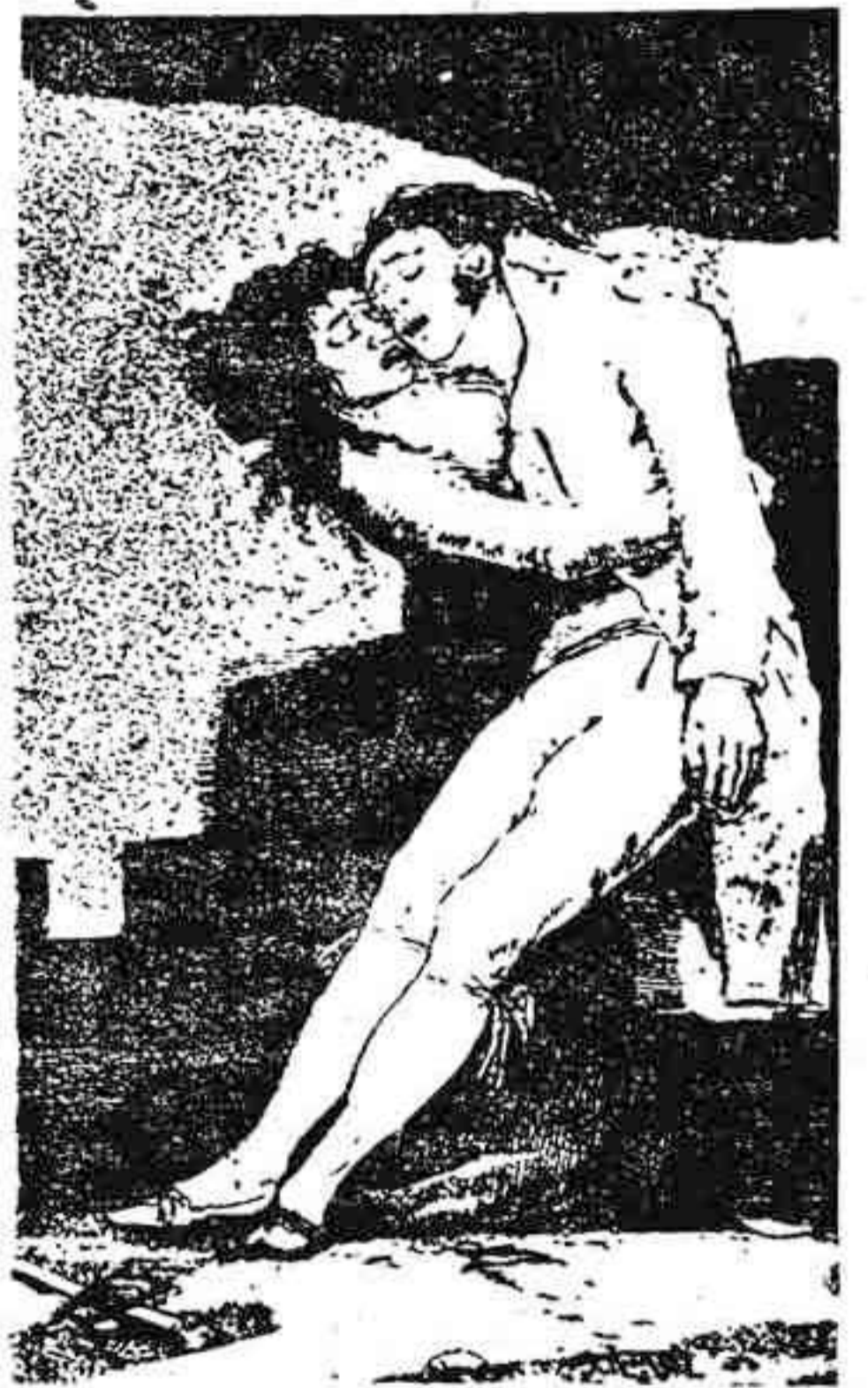
Goya: El amor y la muerte.