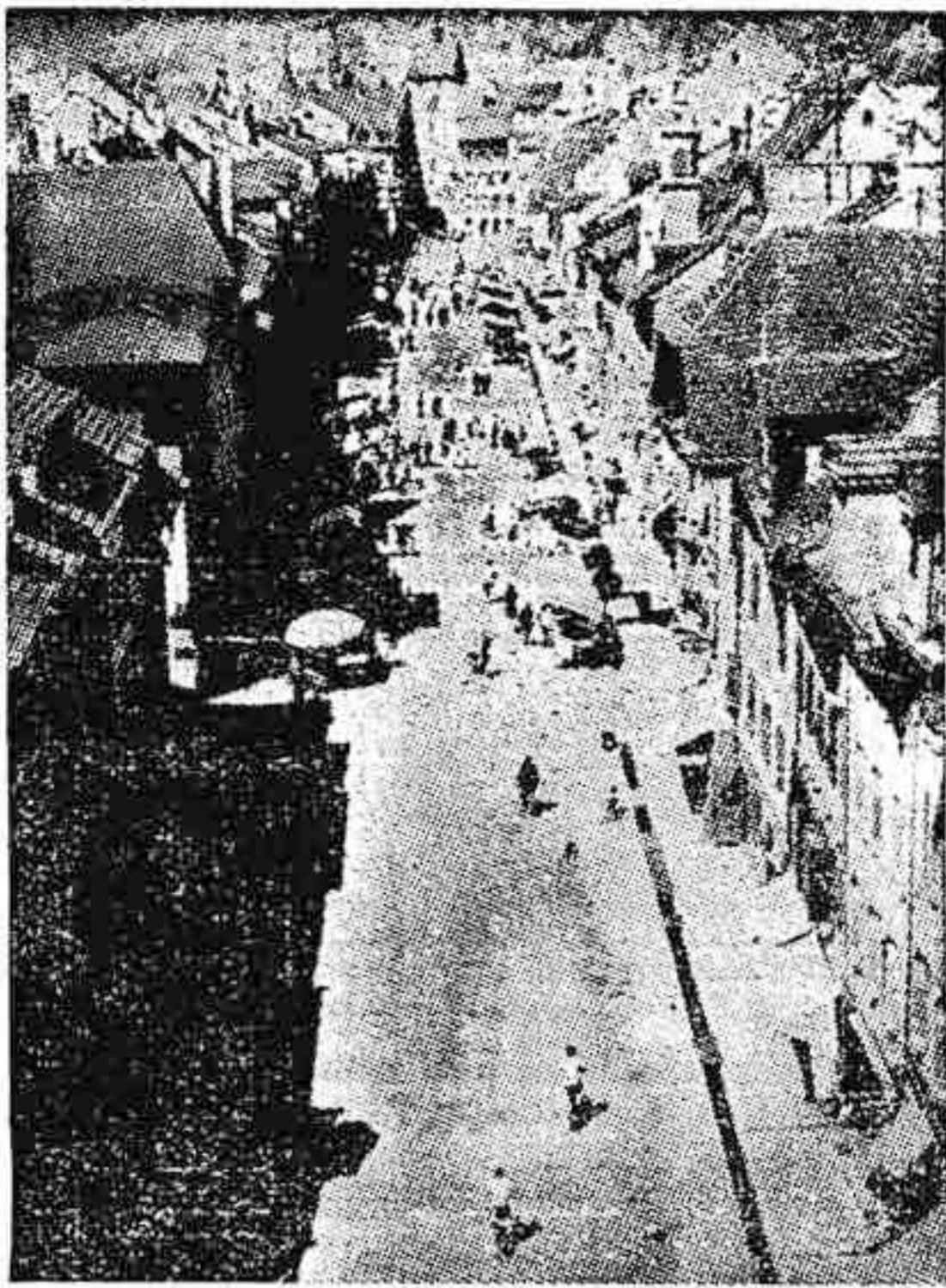
El hombre vive físicamente la arquitectura caminando y penetrando en ella