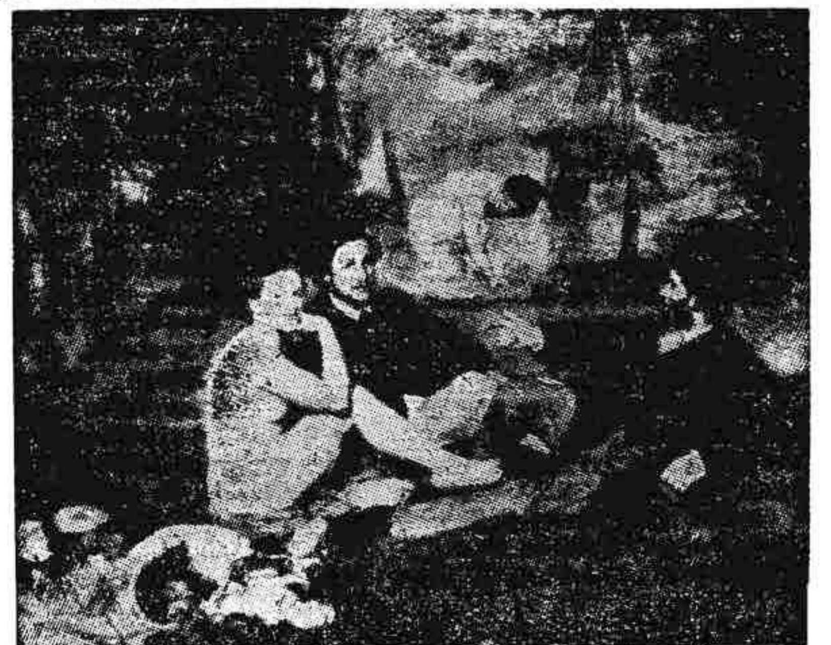
Monet: El desayuno sobre la yerba.